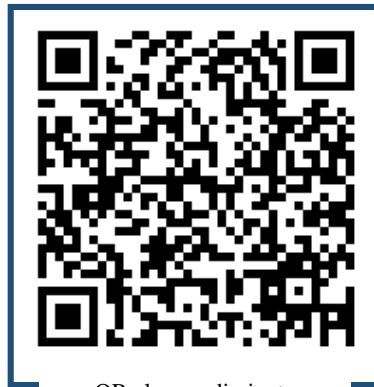
QR al procedimiento